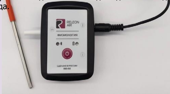
Рис. 12. Датчик температуры тела

Датчик температуры тела — предназначен для непрерывного измерения температуры тела в подмышечной впадине. Оснащен выносным зондом. Диапазон измерения: от 25 до 50 °С. Разрешение датчика: 0,1 °С. Технологическая особенность: для точного измерения в подмышечной впадине должна находиться вся металлическая часть зонда.