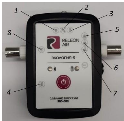
Рис. 2. Мультидатчик по экологии. Обозначение разъёмов и технологических отверстий: 1 — освещённость, 2 — относительная влажность воздуха, 3 — температура окружающей среды, 4 — температура растворов, 5 — нитрат-ионы, 6 — хлорид-ионы, 7 — pH, 8 — электропроводность

Мультидатчик по экологии позволяет измерять следующие показатели: водородный показатель водных сред, концентрации нитрат-ионов и хлорид-ионов, электропроводность, влажность, освещённость, температуру окружающей среды, температуру растворов, растворов и твёрдых тел (рис. 2).