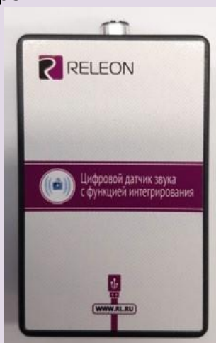
Рис. 7. Датчик звука

Датчик звука — измеряет уровень шумов в окружающей среде и при оценке шумопоглощающих изоляторов. Динамический диапазон: от 30 до 130 дБ. Частотный диапазон: от 50 Гц до 8 кГц. Разрешение: 0,1 дБА (акустические децибелы). Технологические особенности: датчик чувствителен к резким звукам, которые могут дать завышенные результаты измерений.