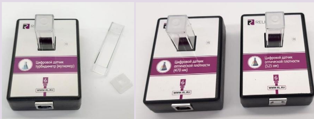
Рис. 8. Датчики мутности (слева), оптической плотности на 465 нм (в центре) и 525 нм (справа)

В комплект входят датчики с различной длиной волн полупроводниковых источников света: 465 и 525 нм. Диапазон измерения коэффициента пропускания света: от 0 до 100 %. Разрешение при измерении коэффициента пропускания: 0,1 %. Диапазон измерения оптической плотности: от 0 до 2 D. Разрешение при измерении оптической плотности: 0,01 D. Длина оптического пути кюветы: 10 мм. Объем кюветы: 4 мл. Технологические особенности: требуется хорошо промывать кювету для исследуемого раствора.