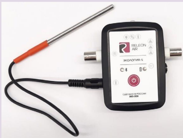
Рис. 6. Датчик температуры растворов

Датчик температуры термопарный предназначен для измерения температур до 900. Используется при выполнении работ, связанных с измерением температур плавления и разложения веществ, а также для измерения температуры в экзотермических процессах.