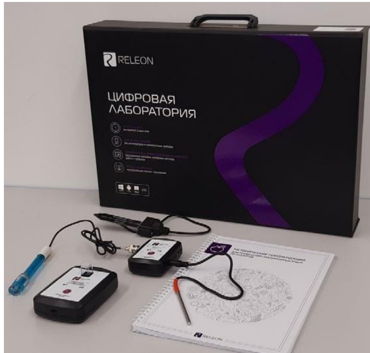
Рис. 1. Цифровая лаборатория

Ниже дана краткая характеристика цифровых датчиков, приведены выявленные на практике технологические особенности применения. Учёт этих особенностей позволит правильно использовать датчики и продлить срок их службы.