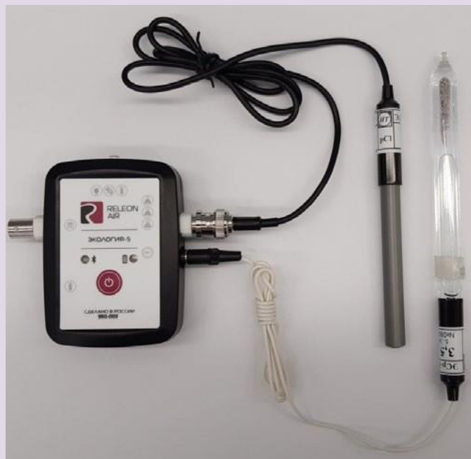
Рис. 10. Ионоселективный датчик (присоединены электро хлорид-ионов и электрод сравнения)

Датчик кислорода — предназначен для определения относительной концентрации кислорода в воздухе. Диапазон измерения: от 0 до 100 %. Разрешение: 0,1 %. Технологические особенности: при измерении содержания газа в выдыхаемом воздухе необходимо держать мембрану максимально близко ко рту; восстановление показаний на воздухе происходит через 1—2 минуты (время диффузии через мембрану).