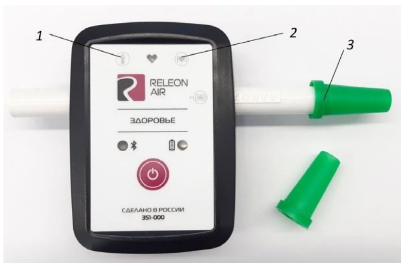
Рис. 3. Мультидатчик по физиологии. Обозначение разъёмов и технологических отверстий: 1 — температура тела, 2 — пульс, 3 — частота дыхания (надет съёмный мундштук)

Мультидатчик по физиологии позволяет определять артериальное давление, пульс, температуру тела, частоту дыхания, ускорение движения (рис 3).