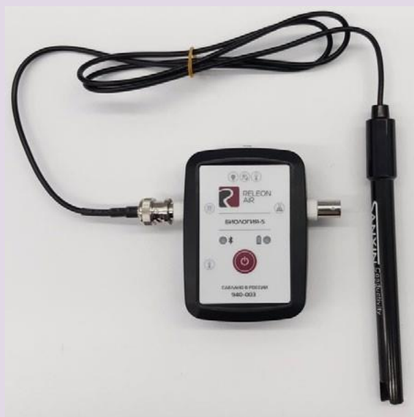
Рис. 5. Датчики электропроводимости

Датчик электропроводимости — предназначен для регистрации и измерения удельной электропроводности жидких сред, в том числе и водных растворов веществ. Применяется при изучении характеристик водных растворов, в том числе почвенных вытяжек.