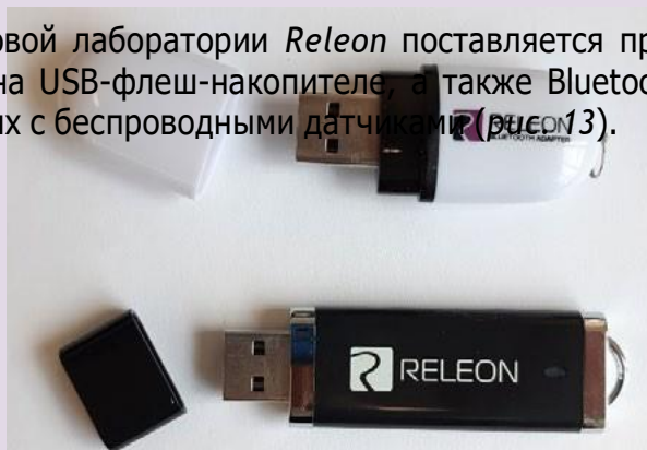
Рис. 13. Общий вид USB-флеш-накопителя (внизу) и Bluetooth-адаптера (вверху)

В комплекте цифровой лаборатории Releon поставляется программное обеспечение Releon Lite на USB-флеш-накопителе, а также Bluetooth-адаптер для связи регистратора данных с беспроводными датчиками (рис. 13).