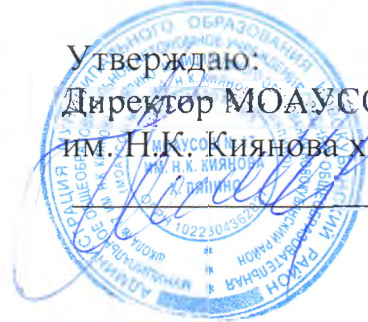
График несения Почетной Вахты Памяти на Посту №1 у Братской могилы советских воинов, погибших в боях с немецко-фашистскими захватчиками в 1942 году