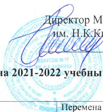
График питания учащихся на 2021-2022 учебный год.