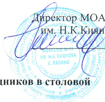
График дежурства сотрудников в столовой